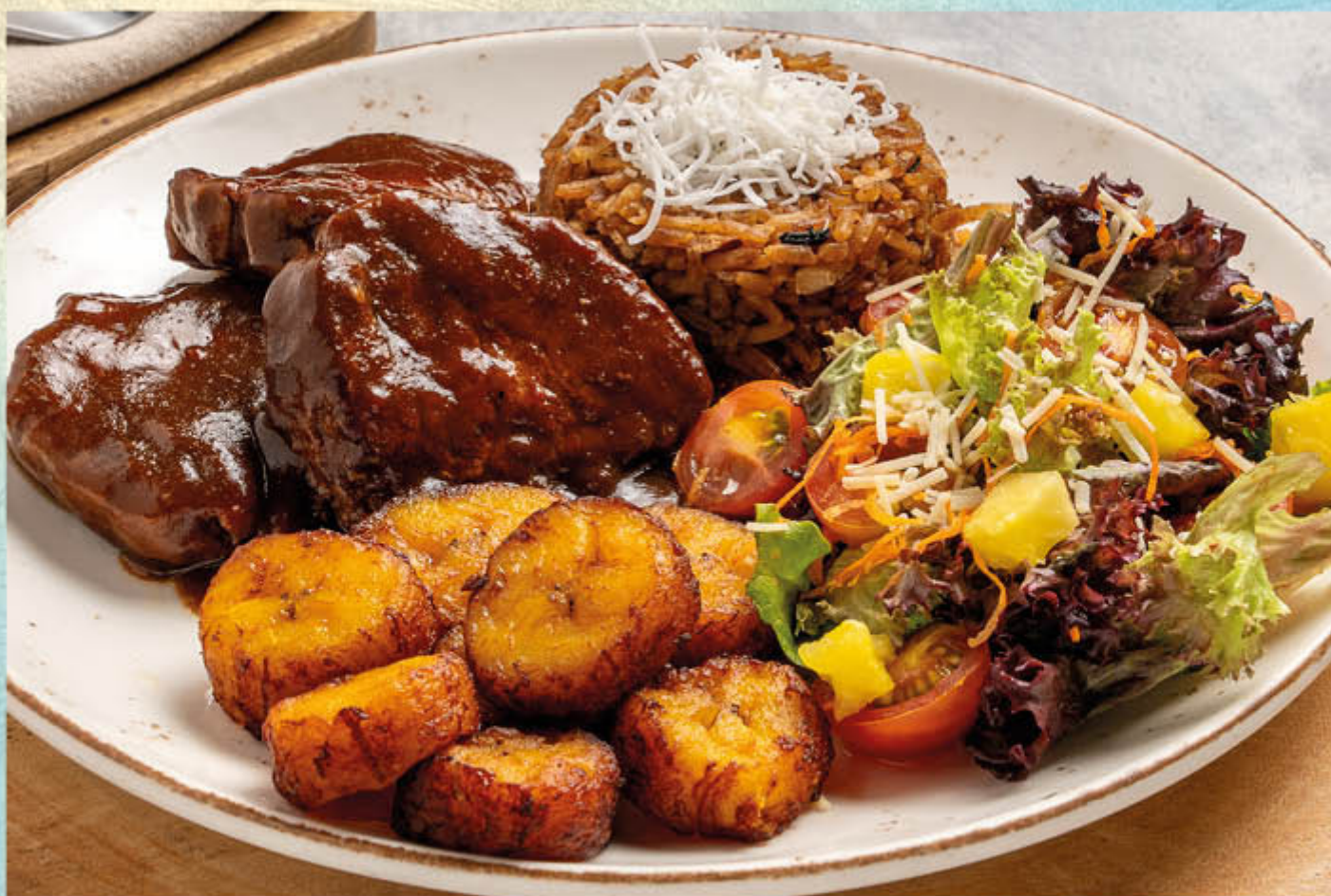
POSTA CARTAGENERA. Medallones de res bañados en la tradicional salsa, acompañados de ensalada fresca, plátano maduro y arroz con coco.