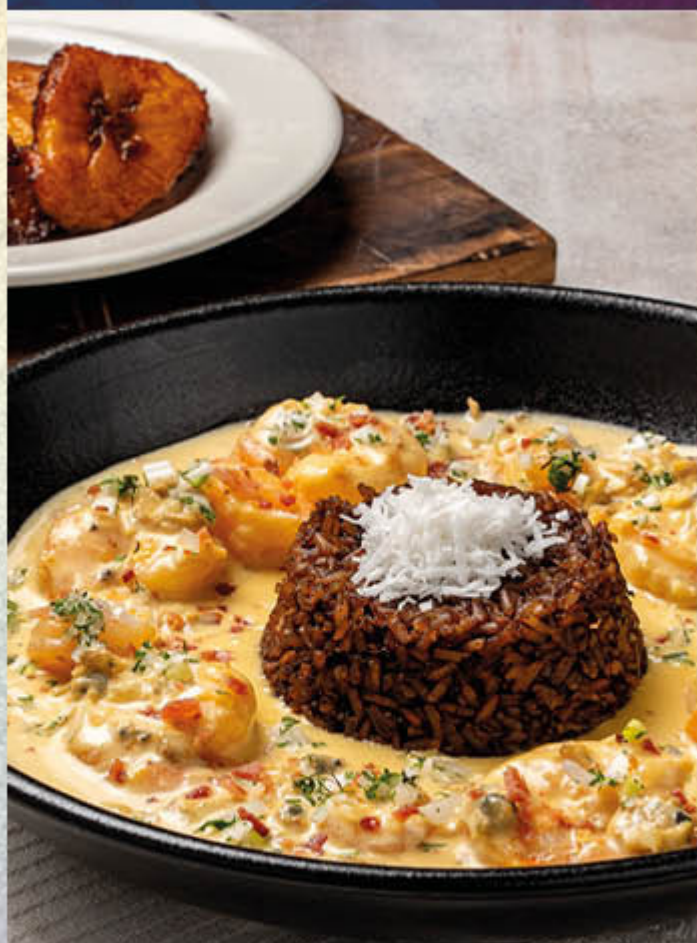
LANGOSTINOS AL AJILLO. Langostinos y camarones salteados al ajillo acompañados de arroz con coco y plátano maduro. $78.400