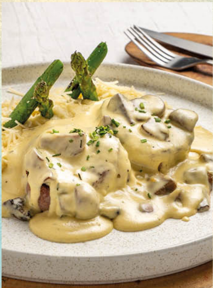
FILET MIGNON. Medallones de res bañados en salsa de champiñones, acompañados de pure, espárragos y queso parmesano.