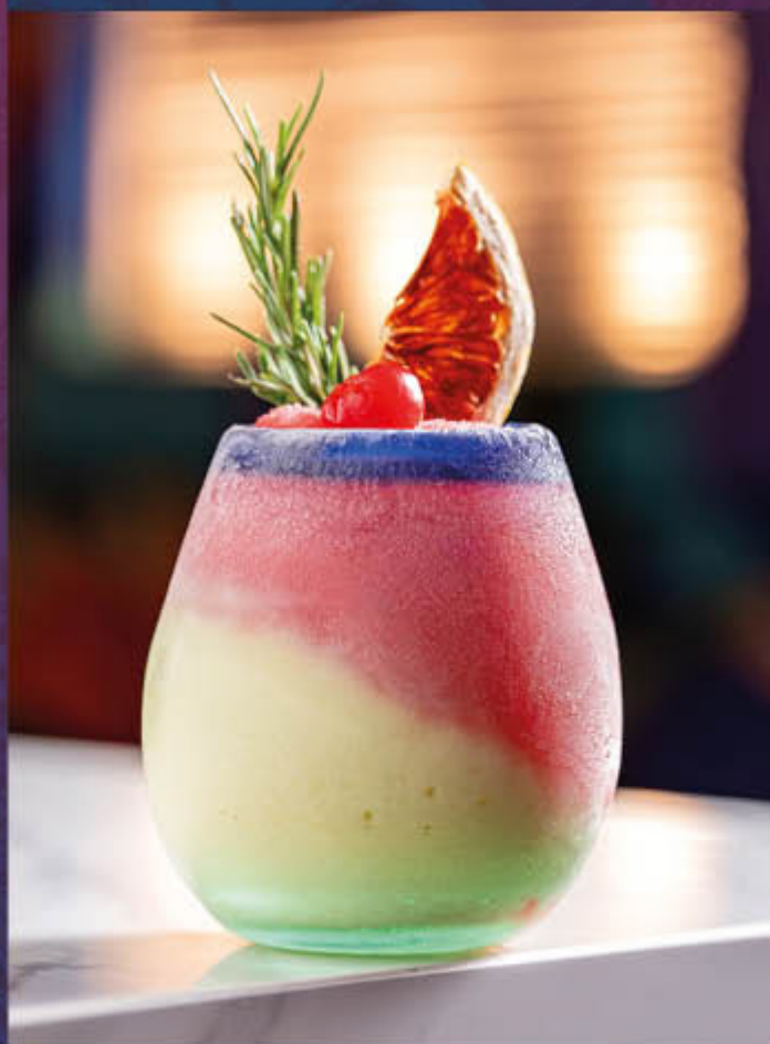
MARGARITA DE FRESA Y PIÑA COLADA. Cóctel a base de tequila, zumo de limón, almíbar de frutos rojos / cereza y pulpa de fresa y Piña Colada.