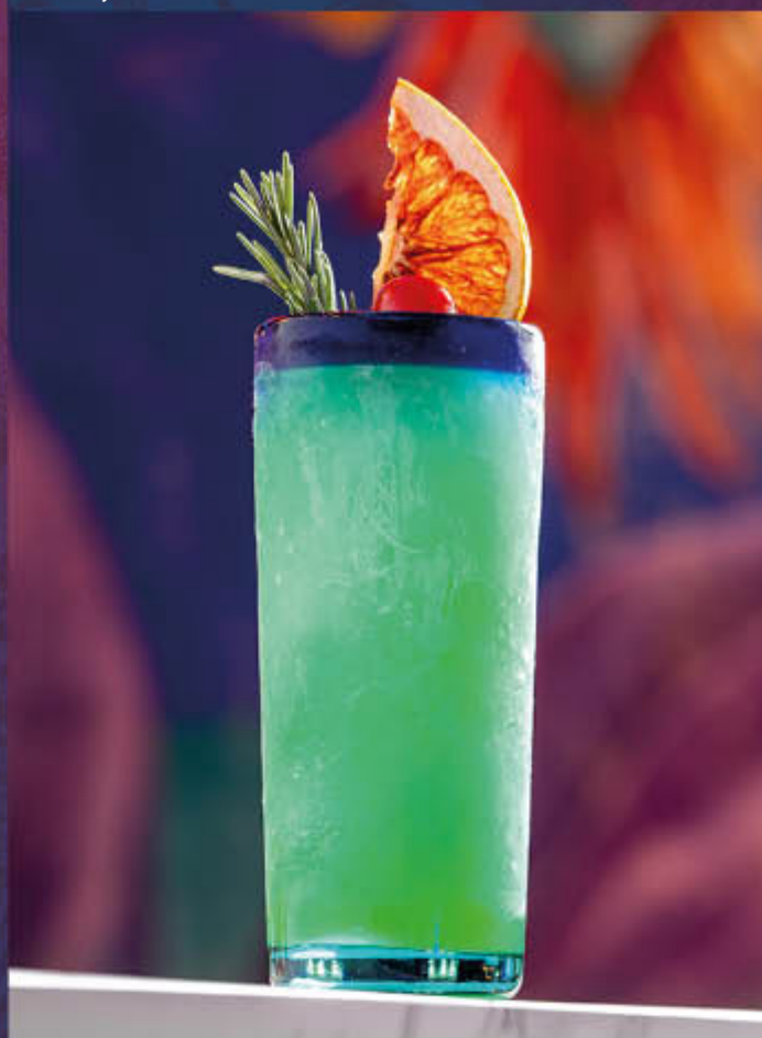
MOJITO. 90 ml de Ron Bacardi carta blanca, 30 ml de Triple sec, zumo de limón, hierbabuena, y soda.