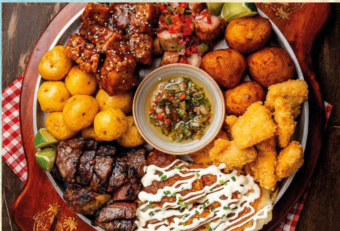
PICADA ISLAMORADA. (Para dos personas) 300 gr de bife de chorizo a la parrilla, cubitos de pollo apanados, chorizo santarrosano con pico de gallo de la casa, crujiente chicharrón bañado con nuestra salsa BBQ de lulo, papitas criollas fritas y nuestra tradicional arepa de choclo con suero costeño.