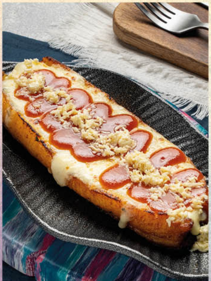
PLÁTANO CON QUESO Y BOCADILLO. Plátano maduro cocido en fritura profunda, luego relleno con queso fundido y salsa de bocadillo.