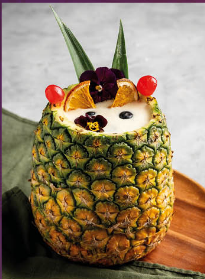
PIÑA COLADA ISLAMORADA. 140 ml de Ron blanco, pulpa de piña, helado de vainilla & mix de coco. $64.400