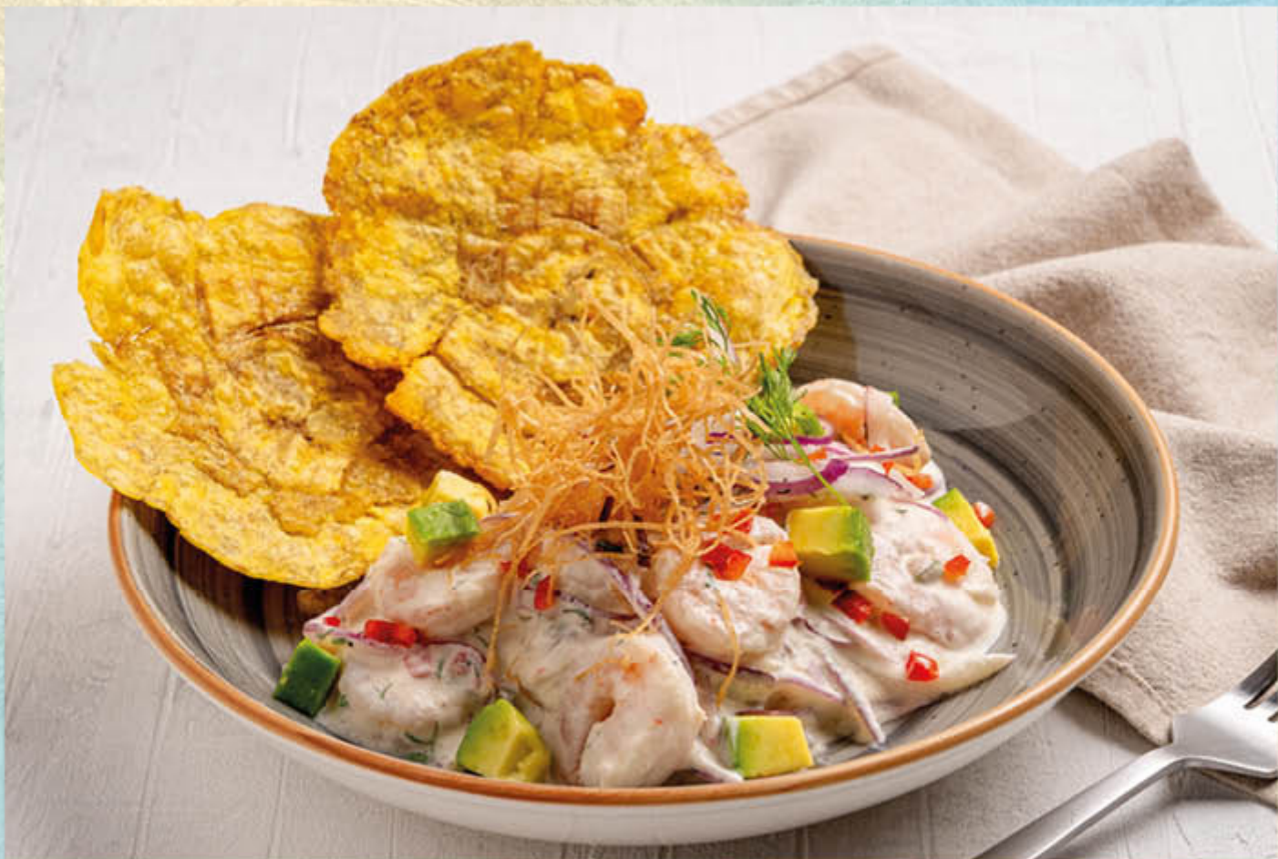
CEVICHE CREMOSO DE CAMARONES. Delicioso ceviche de camarones en leche de tigre cremosa, cebollitas, aguacate y cilantro.