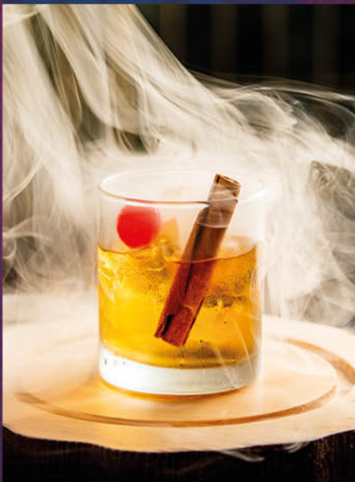
OLD FASHION. Cóctel clásico a base de whisky, caña de azúcar, gotas de angostura, canela cinnamon, cerezas y medialuna de naranja. Ahumado con astillas de guayabo, clavo y canela.