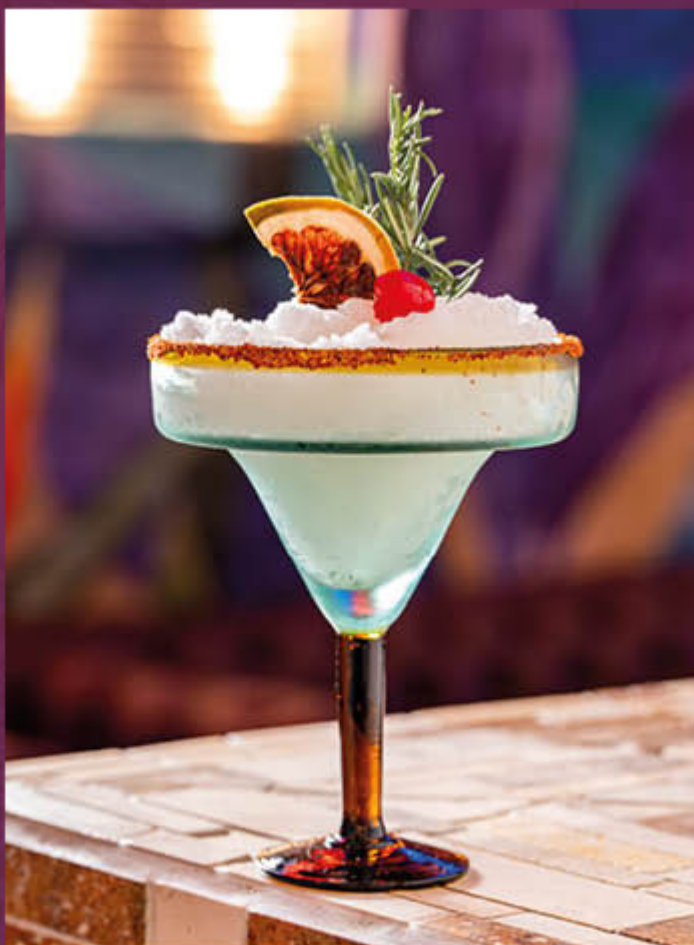
MARGARITA FRAPPÉ. Cóctel a base de tequila José Cuervo, zumo de limón y triple sec, michelado con tajín y sal.