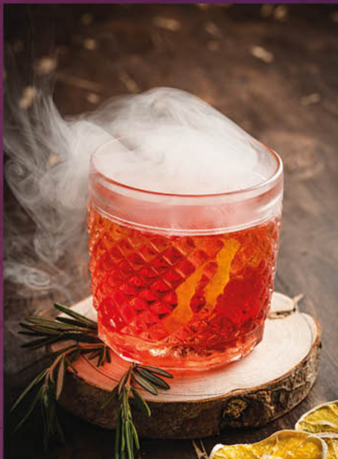
NEGRONI. Cóctel a base de ginebra, cinzano Rosso y campari, acompañado con cerezas y ahumado con astillas de guayabo, clavo y canela.