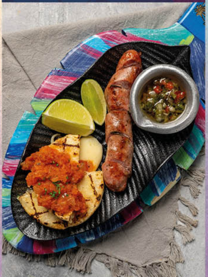
CHORIZOS ARTESANALES ANTIOQUEÑOS. Acompañado de arepa rellena de queso parrillada con chimichurri y cascos de limón. $28.000