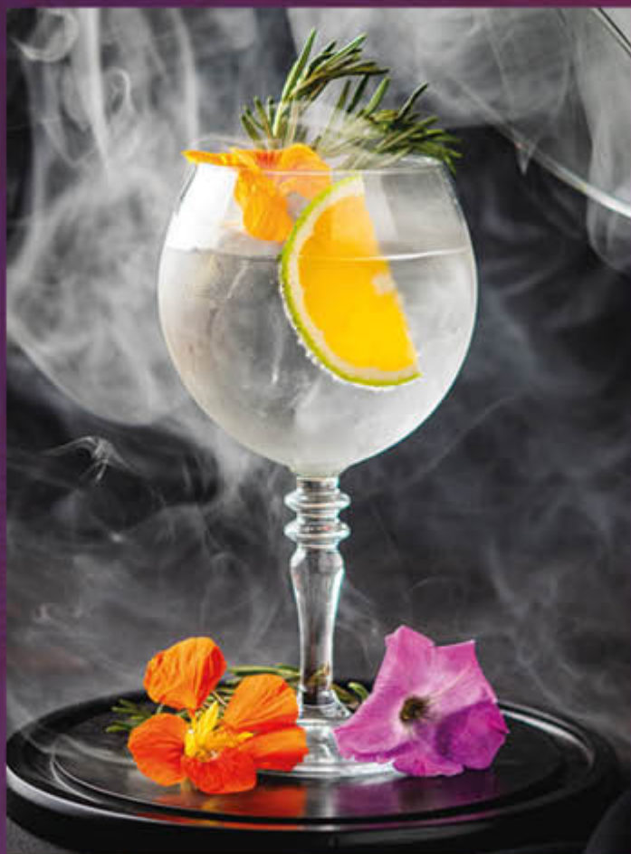
GIN & TONIC. 75 ml de Ginebra, deshidratados, mix de pieles cítricas, flor comestible & tónica.