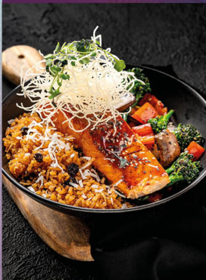
SALMON TERIYAKI. Salmón sellado en plancha bañado en salsa teriyaki acompañado de arroz de coco y vegetales salteados.