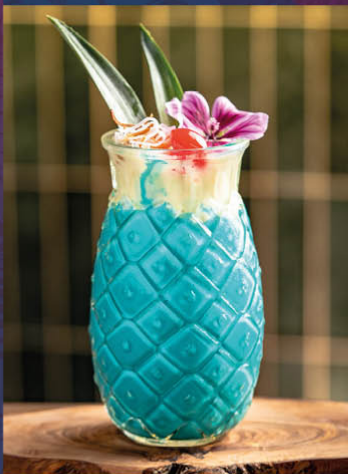
PIÑA COLADA AZUL. Cóctel a base de ron blanco, pulpa de piña, helado de vainilla, leche y mezcla de coco. Acompañado de cerezas, coco rallado y flores. $35.000