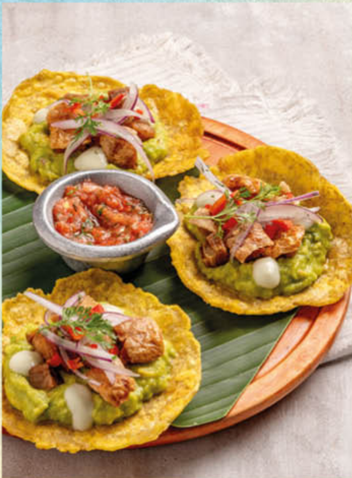
TOSTONES DE CHICHARRON. Tostones de plátano verde con guacamole y chicharrón crocante. $45.000