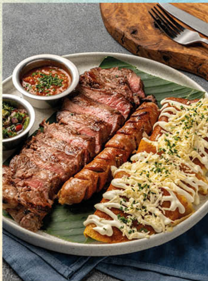
BIFE Y CHOCLO. Exquisita dupla de arepas de choclo rellenas de queso mozzarella, bañadas en suero y coronadas con queso costeño, acompañadas de 380 grs de bife al carbón y un buen chorizo santarosano, acompañados de hogao criollo y chimichurri.