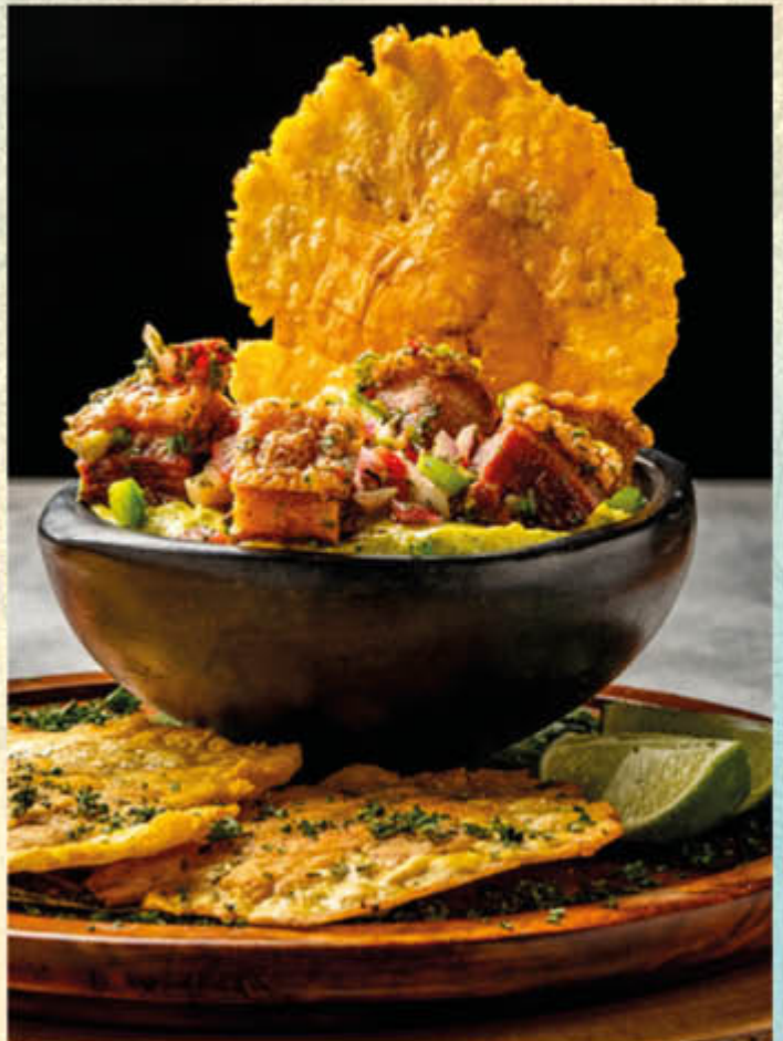
CHICHARRONES CROCANTES CON GUACAMOLE. Crocantes chicharrones servidos sobre guacamole con toques de pico de gallo y chimichurri, acompañados con patacones. $45.800