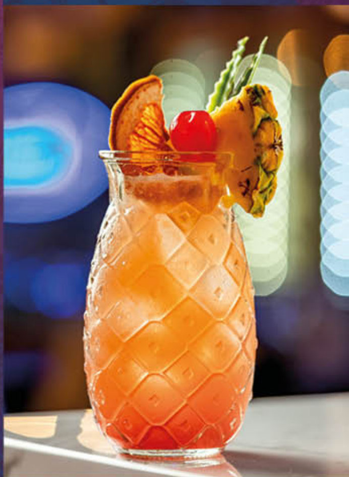
PINEAPPLE SMASH. Cóctel a base de ron blanco, almíbar de piña, zumo de limón, almíbar de frutos rojos y campari. Acompañado de piña, cereza y deshidratado cítrico. $40.000