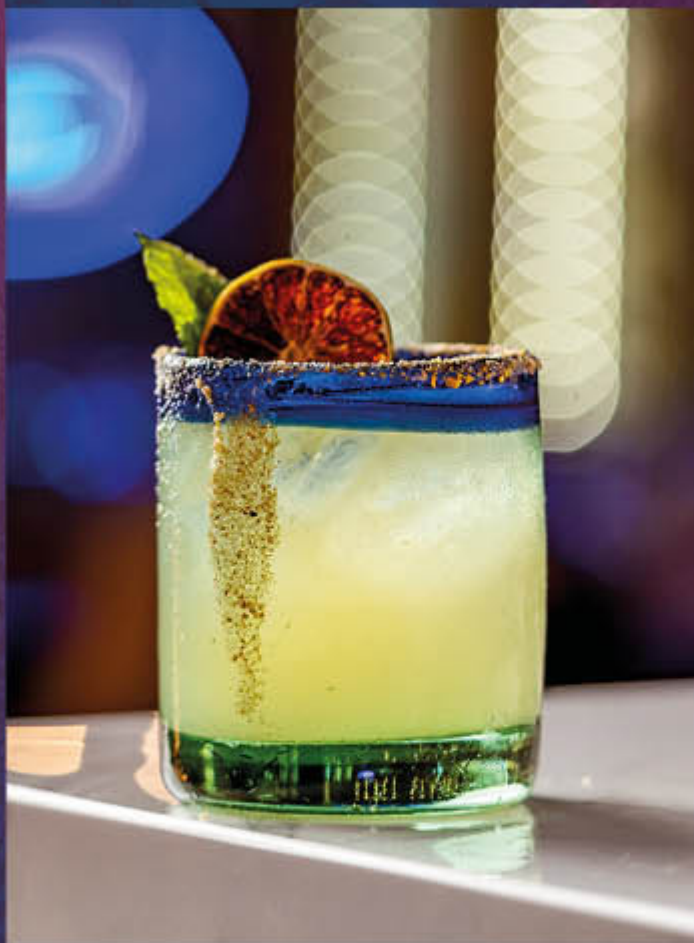
TROPICAL GINGER. Cóctel a base de tequila, almíbar de jengibre, zumo de limón y vermut blanco. Acompañado con sal de jengibre, deshidratado cítrico y hierbabuena.