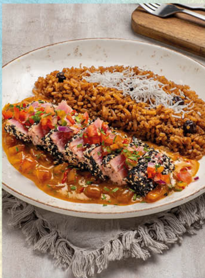
ATÚN CARIBE. Lomo de atún fresco encostrado en ajonjolí, ligeramente sellado, acompañado de chutney de frutas tropicales y arroz coco. $64.000