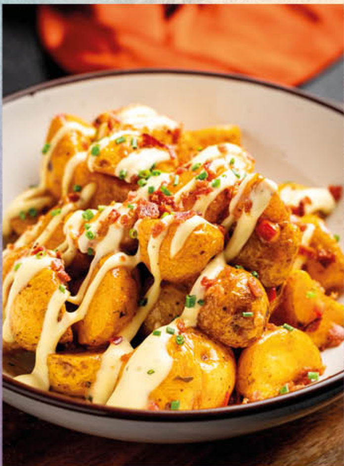
PAPAS BRAVAS. Papitas criollas fritas bañadas con salsa dinamita, tocineta y salsa de ajo.