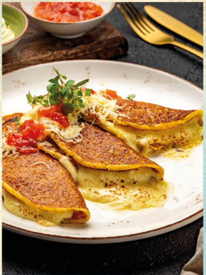
AREPAS DE CHOCLO. Receta clásica de la casa, rellenas de queso y mermelada de tomate de árbol. $28.000