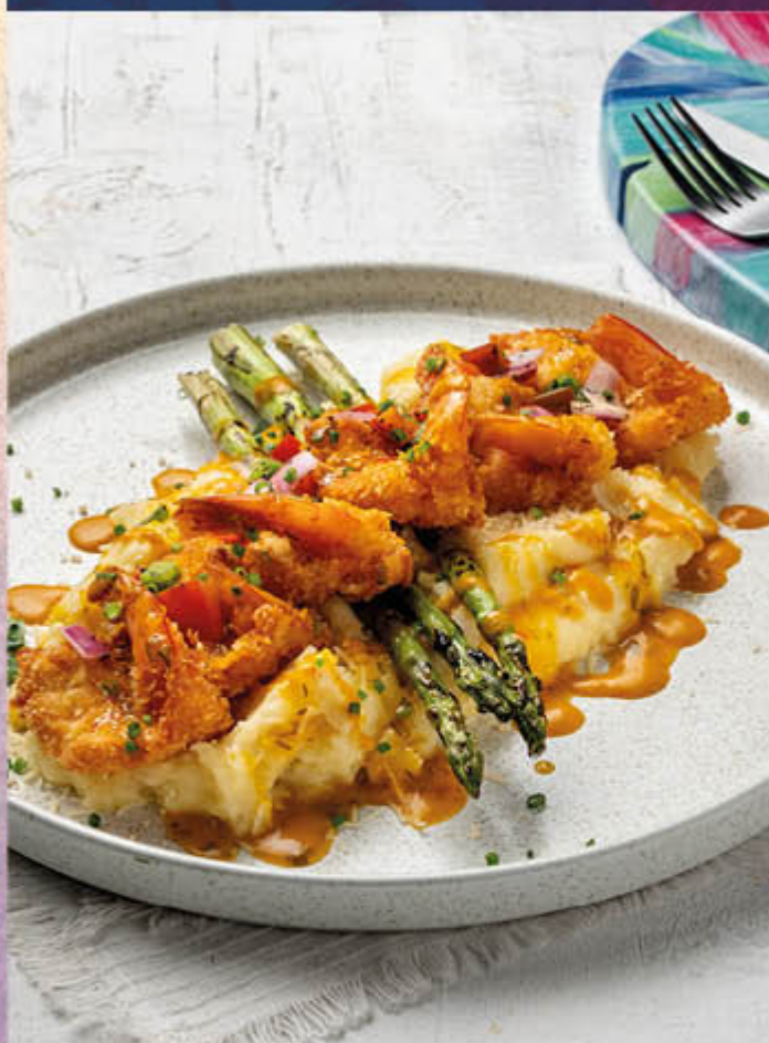
LANGOSTINOS APANADOS. Langostinos crocantes montados sobre cama de pure cremoso con salsa de ají amarillo y salsa agrídulce para su contraste de sabor acompañado de espárragos parrillados. $78.400