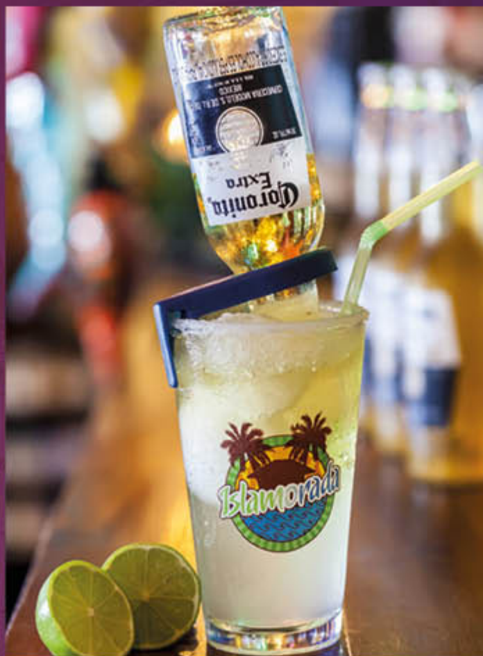
CORONA MARGARITA. Cóctel a base de tequila, zumo de limón, triple sec, michelada el borde con tajín y sal, complementándolo con una coronita.