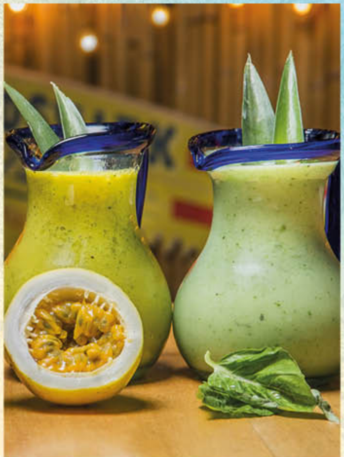
JUGOS FUSIÓN ISLAMORADA EN MINI JARRA Mango-Maracuyá con hierbabuena