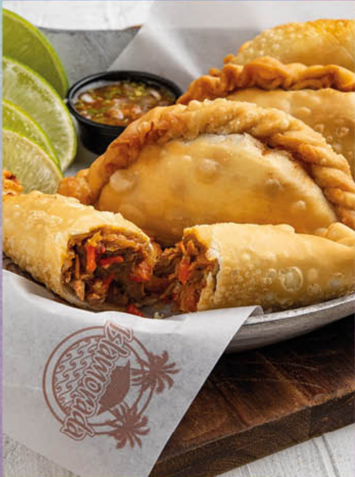
EMPANADAS DE ROPA VIEJA. Rellenas de nuestro tradicional sabor Islamorada.