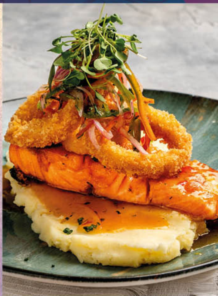
SALMÓN PASIÓN. Salmón a la plancha con salsa agrídulce de maracuyá, sobre cremoso puré de papa, servido con calamares apanados.