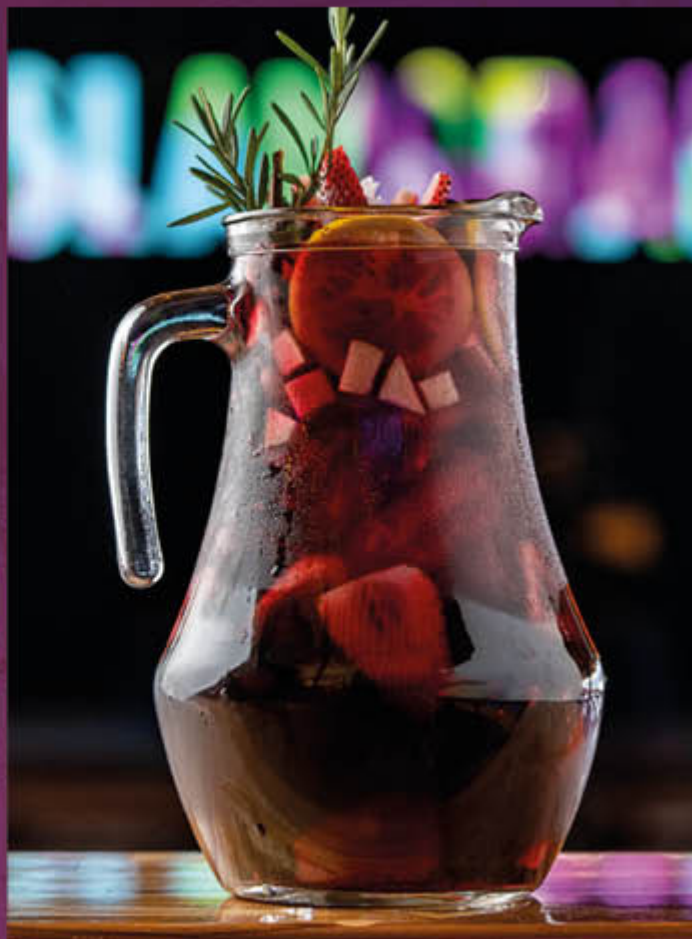
SANGRÍA JARRA (Para 4 personas). Cabernet Sauvignon, 140 ml de Brandy Domeco, 60 ml de Triple sec, zumo de naranja, mix de frutas de temporada, cítricos & syrup de maracuyá.