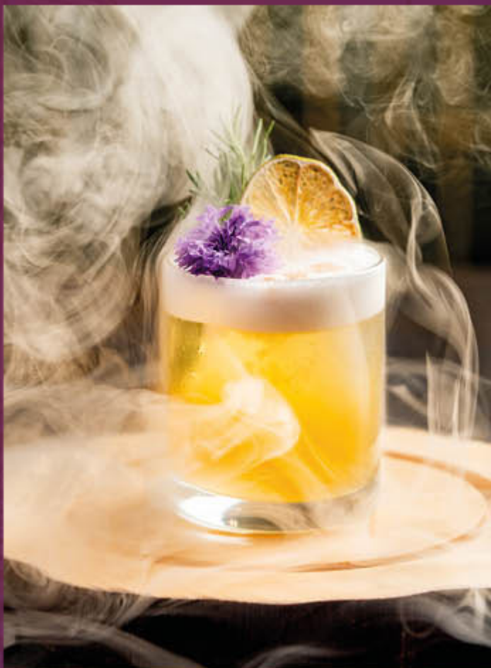
WHISKY SOUR. Cóctel a base de whisky, zumo de limón, syrup simple y el toque secreto de la albumina, ahumado con astillas de guayabo, clavo y canela.