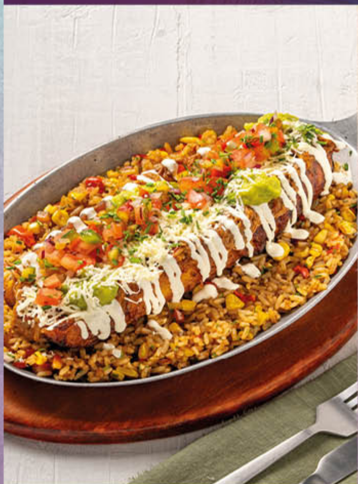
MADURO FUSIÓN. Arroz frito y plátano relleno de carne desmechada, con queso costeño y picadillo criollo de vegetales frescos.