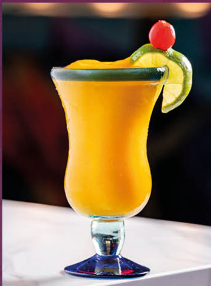
DAIQUIRI DE MANGO. Ron con frappé de mango.