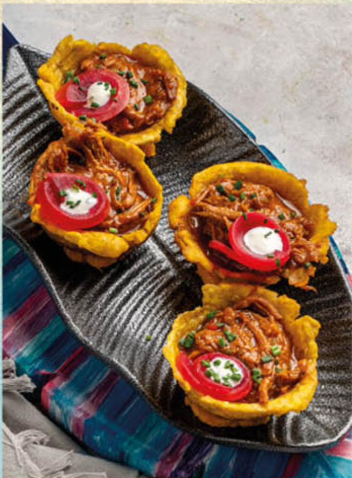
CANASTAS DE PLÁTANO. Crocantes de plátano verde rellenos con ropa vieja, rábanos encurtidos y alioli blanco.