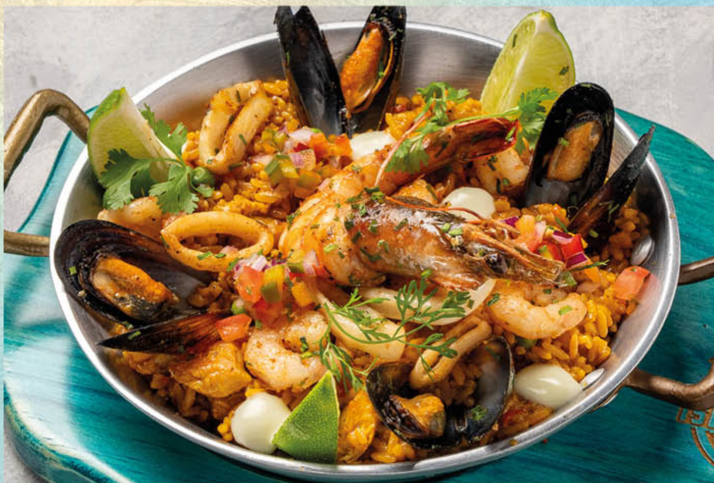
ARROZ CON MARISCOS. Delicioso arroz que mezcla lo mejor de los mariscos con cerdo y pollo.