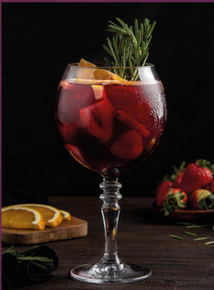
SANGRÍA VASO. Cabernet Sauvignon, 22 ml de Brandy Domeco, Triple sec, zumo de naranja, mix de frutas de temporada, cítricos y syrup de maracuyá.