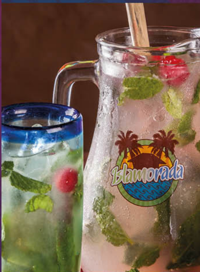
JARRA DE MOJITO (4 PERSONAS). 360 ml de Ron blanco, 120 ml Triple sec, zumo de limón, syrup, hierbabuena & soda.