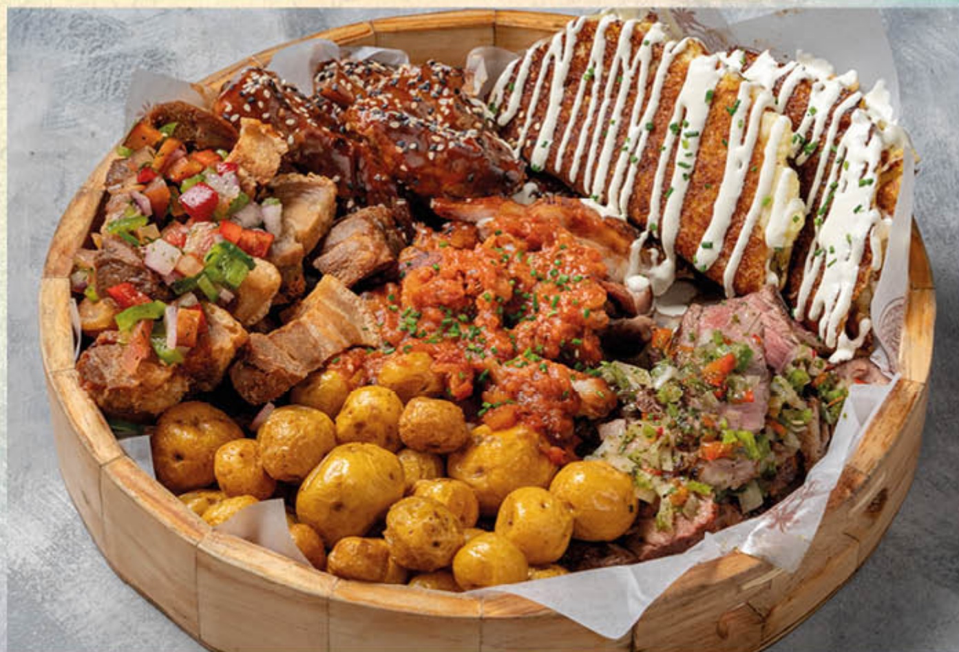
PICADA PARRILLERA. (Para dos personas) Bife de chorizo, costilla de cerdo y filete de pollo a la parrilla bañados con salsa criolla, chimichurri y salsa BBQ, chicharrones crocantes con pico de gallo, arepas de choclo con suero costeño y papas criollas.