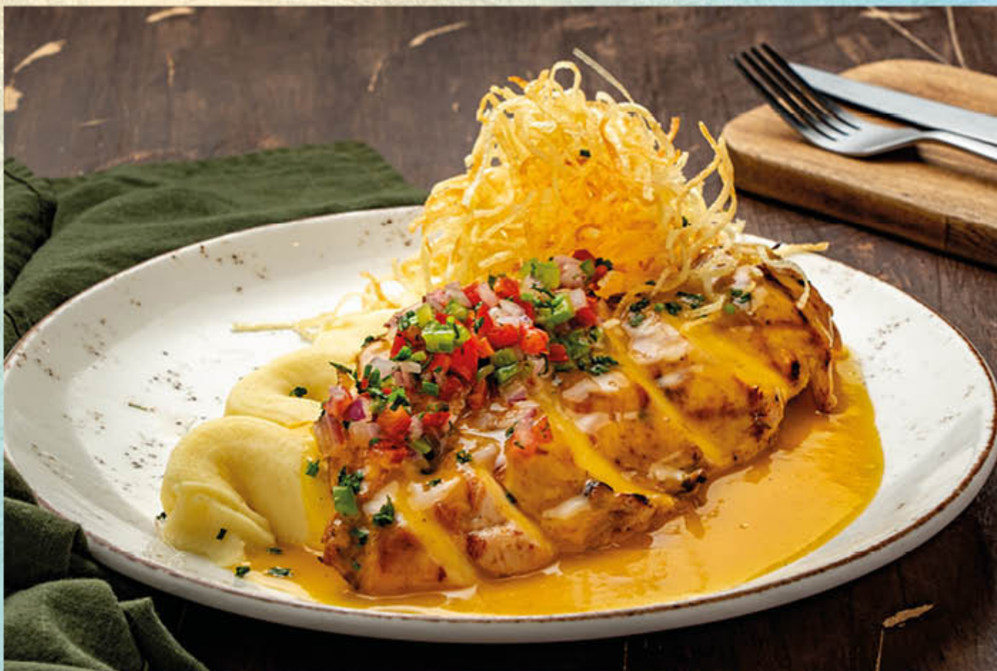
POLLO PASIÓN. Pechuga de pollo montada sobre pure de papas, bañado en nuestra salsa pasión a base de maracuyá y crema.