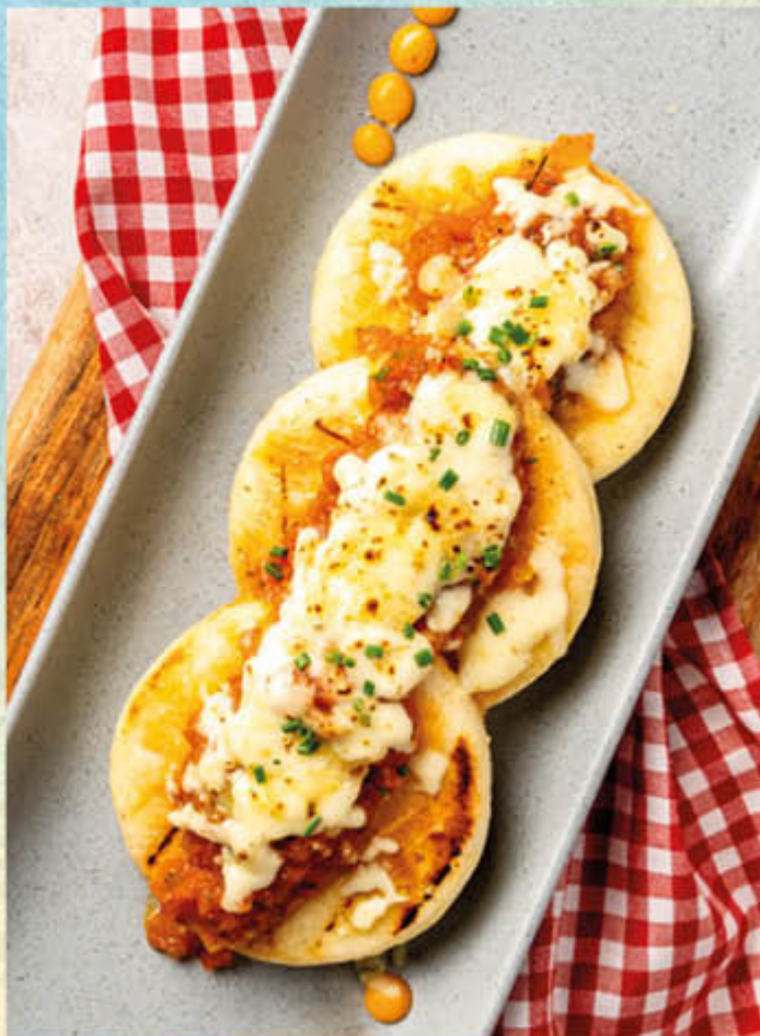
AREPAS CON HOGAO. Arepas rellenas con queso, asadas a la parrilla y terminadas con hogao y queso paipa gratinado. $24.400