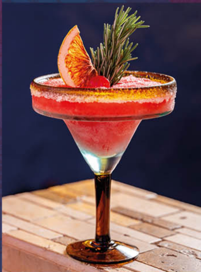
MARGARITA DE FRESA. Cóctel a base de tequila (3 oz), zumo de limón, almíbar de frutos rojos / cereza y pulpa de fresa, acompañado de deshidratado de naranja, cereza, hierbabuena y flores.