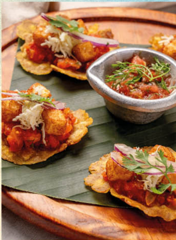
PATACONES CON HOGAO. Montaditos de patacones con hogao de la casa, queso frito con cebollitas y cilantro.