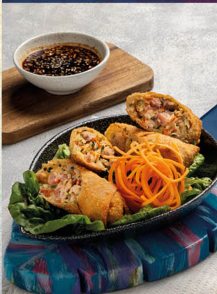
SPRING ROLLS MAR Y TIERRA. Rica entrada de rollitos asiáticos rellenos de vegetales, cerdo y camarones con las más deliciosas especias asiáticas. $28.000