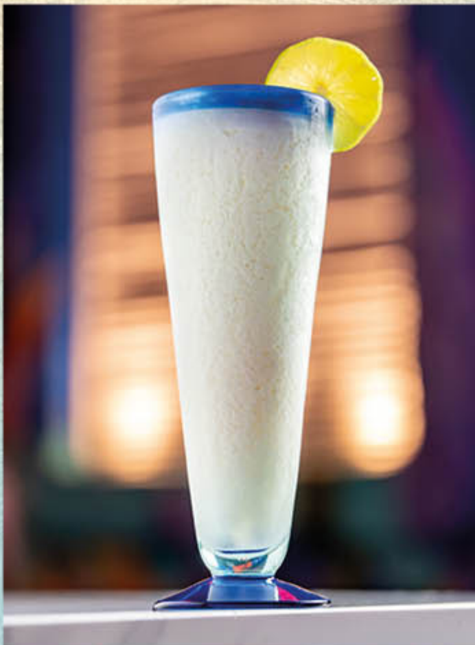
LIMONADA DE COCO (con crema de coco real)