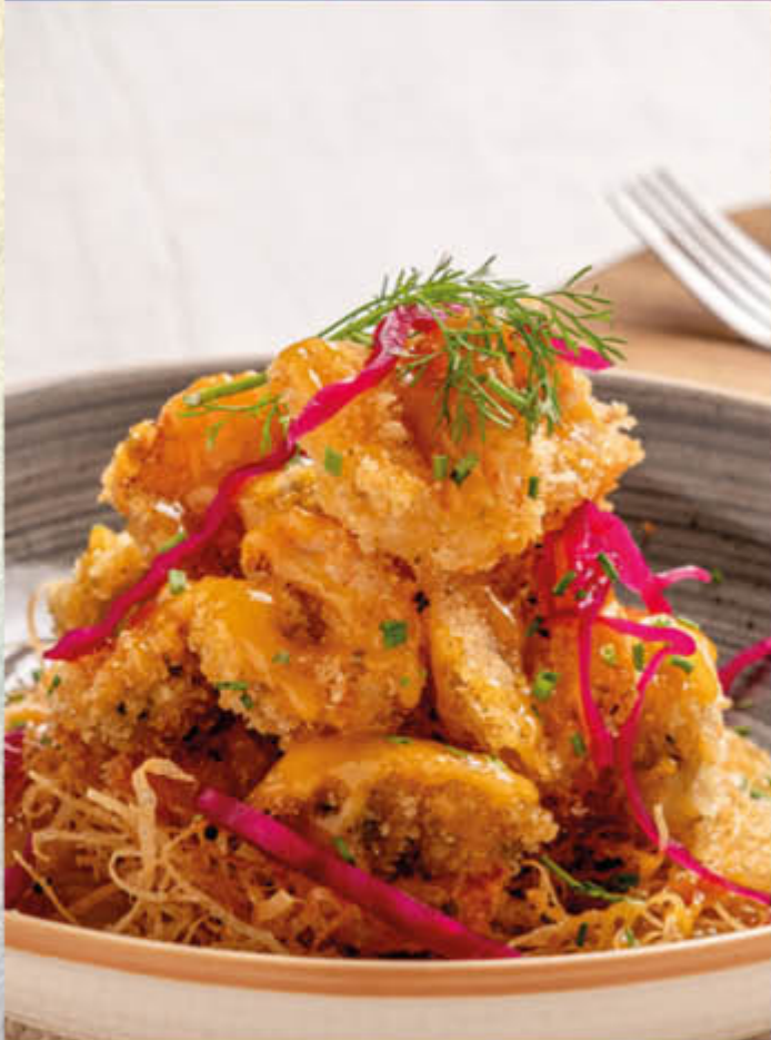
CAMARONES APANADOS. Camarones crocantes bañados en salsa a base de curuba. $42.800