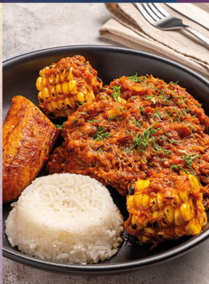
SOBREBARRIGA. Sobrebarriga sellada y cocinada en su propia salsa, acompañada de arroz blanco, maduro y mazorcas.