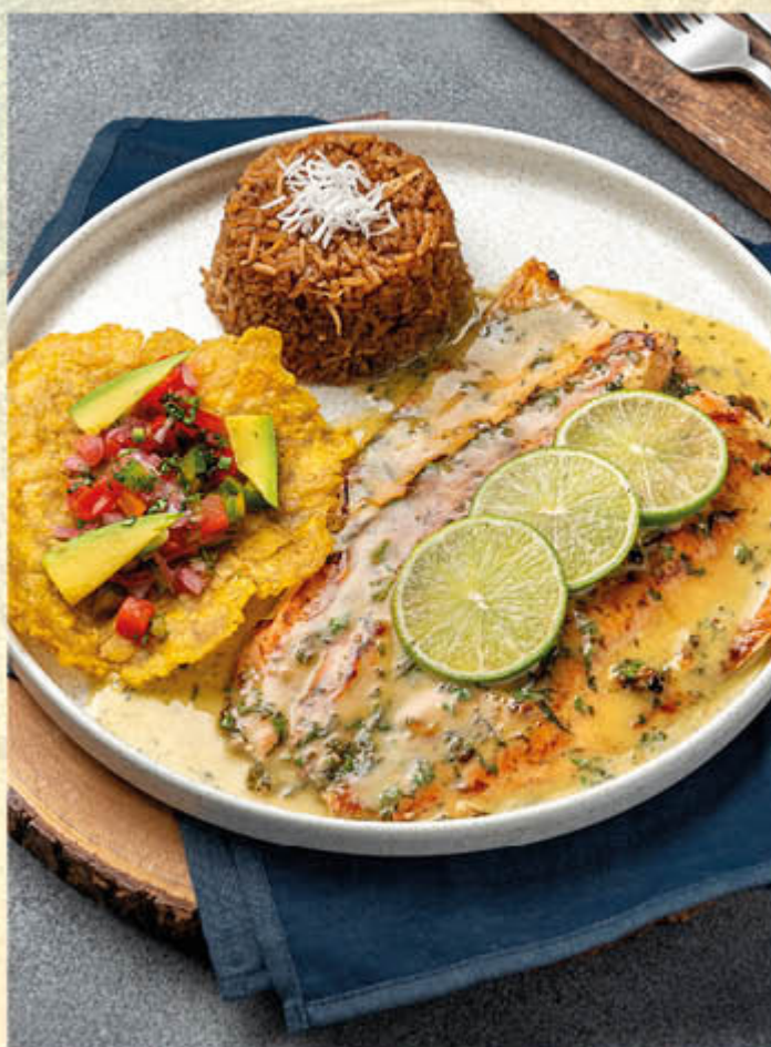
TRUCHA AL AJILLO. Trucha asada bañada en nuestra salsa de ajillo, acompañada de arroz coco, patacón y pico de gallo. $74.000