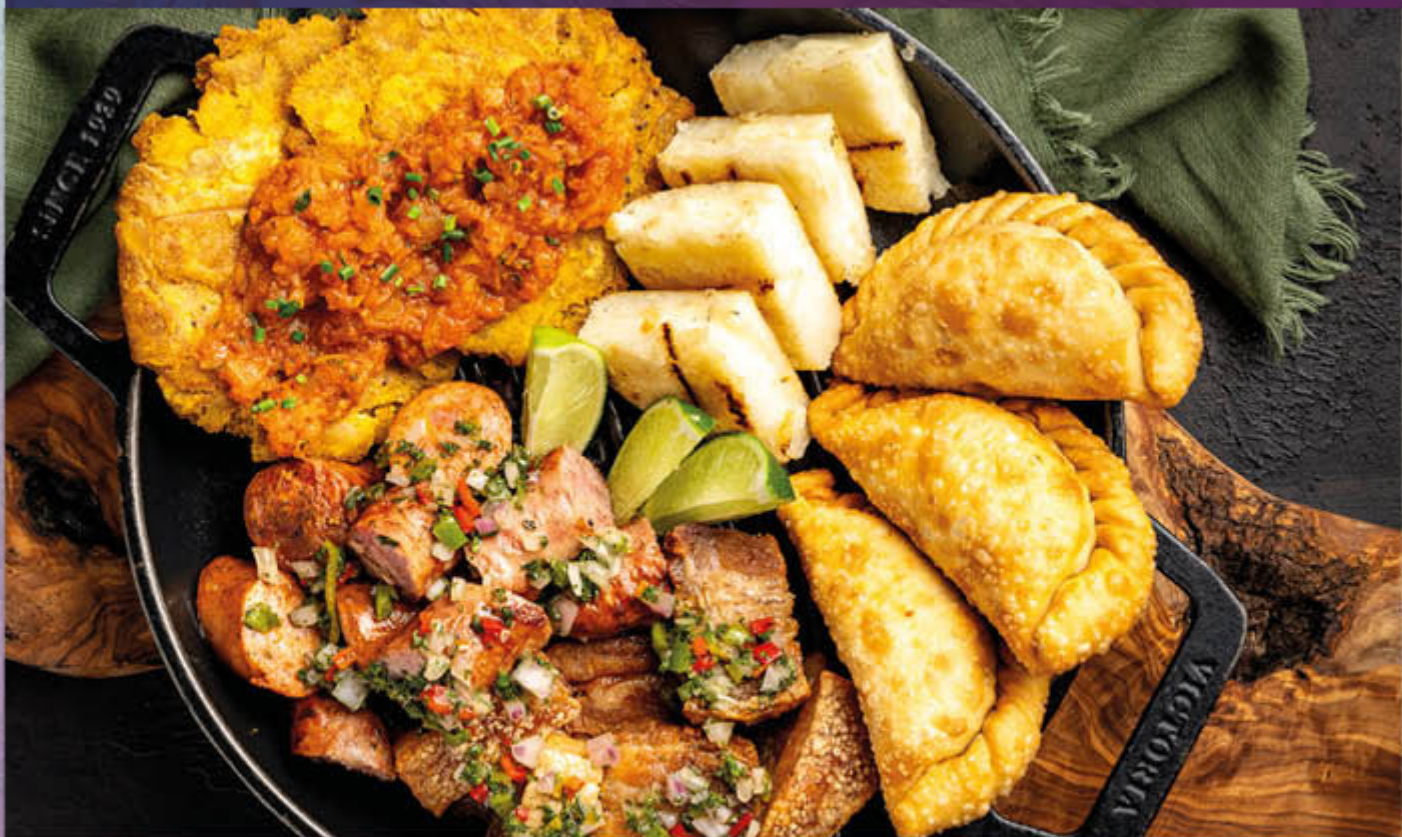
PICADA MIX DE FRITOS. Ideal para compartir, mixto de chorizo, chicharrones, empanadas de ropa vieja, arepas a la parrilla con queso y patacones con hogao.