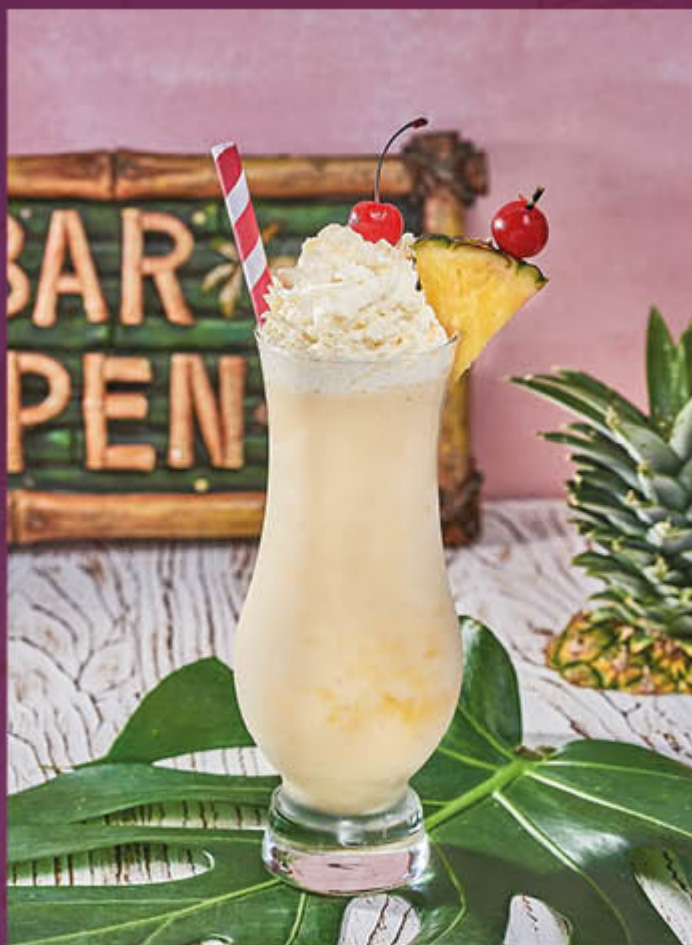
PIÑA COLADA (COPA). 45 ml de Ron blanco, pulpa de piña, helado de vainilla & mix de coco. $35.000