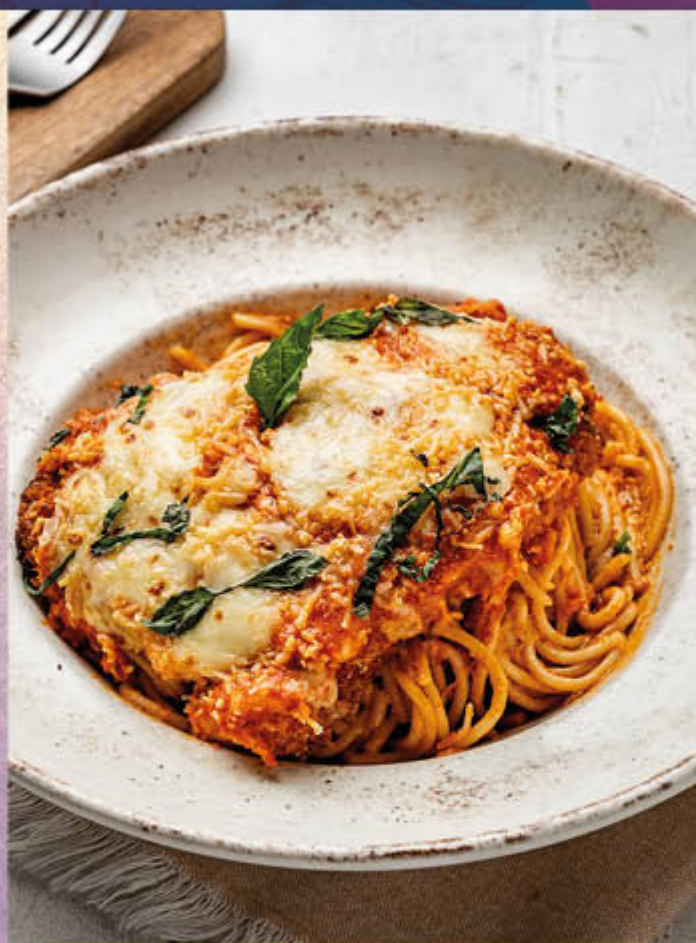
POLLO PARMESANO. Exquisita pieza de pollo crocante, bañada en salsa italiana, gratinada con variedad de quesos, acompañada de spaguettis.