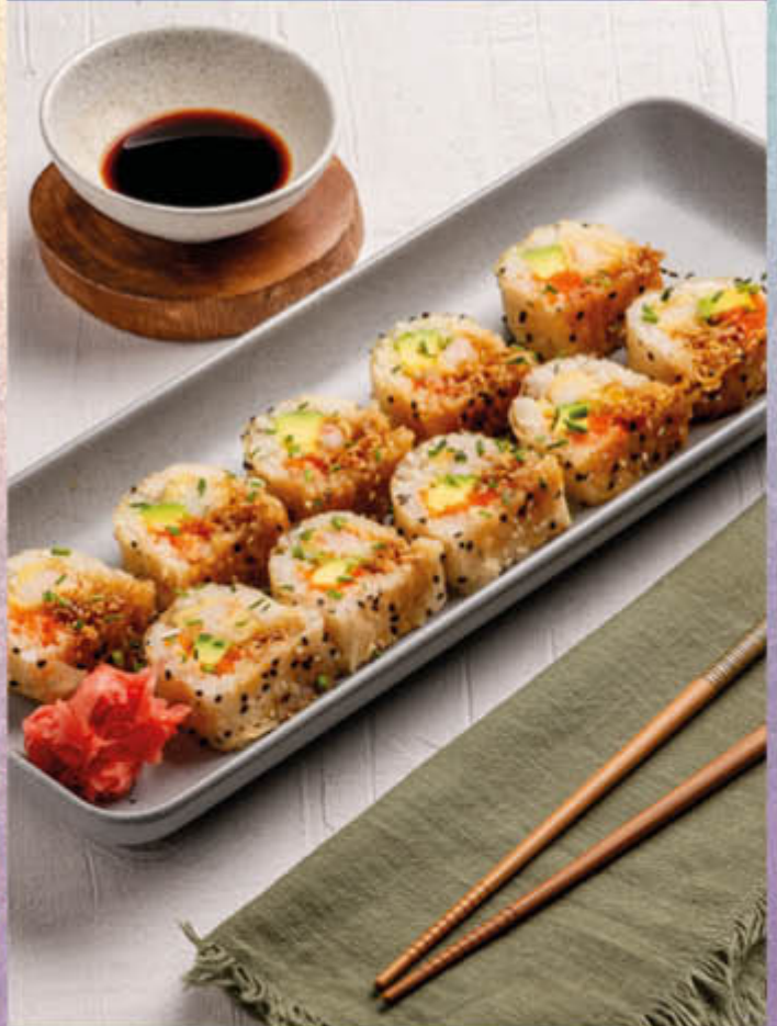
COCONUT SHRIMP ROLL. Exquisito rollo al mejor estilo Islamorada, relleno de langostinos, aguacate, masago y una deliciosa cocada. $48.000