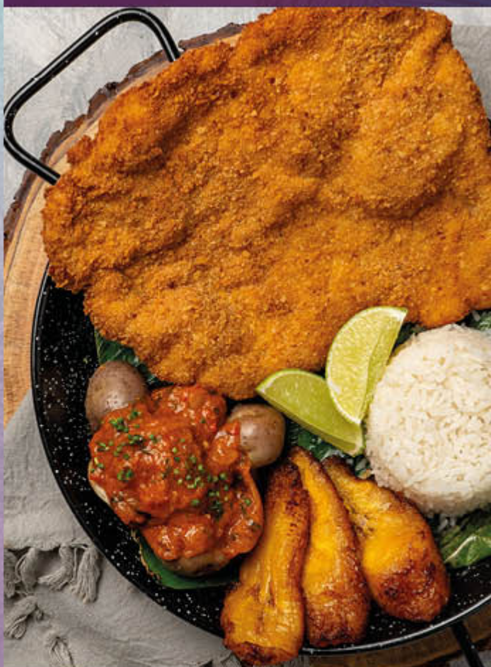
CHULETA VALLUNA. Milanesa de cerdo marinada y apanada al mejor estilo valluno, acompañada de papas chorreadas, arroz blanco y plátano maduro.