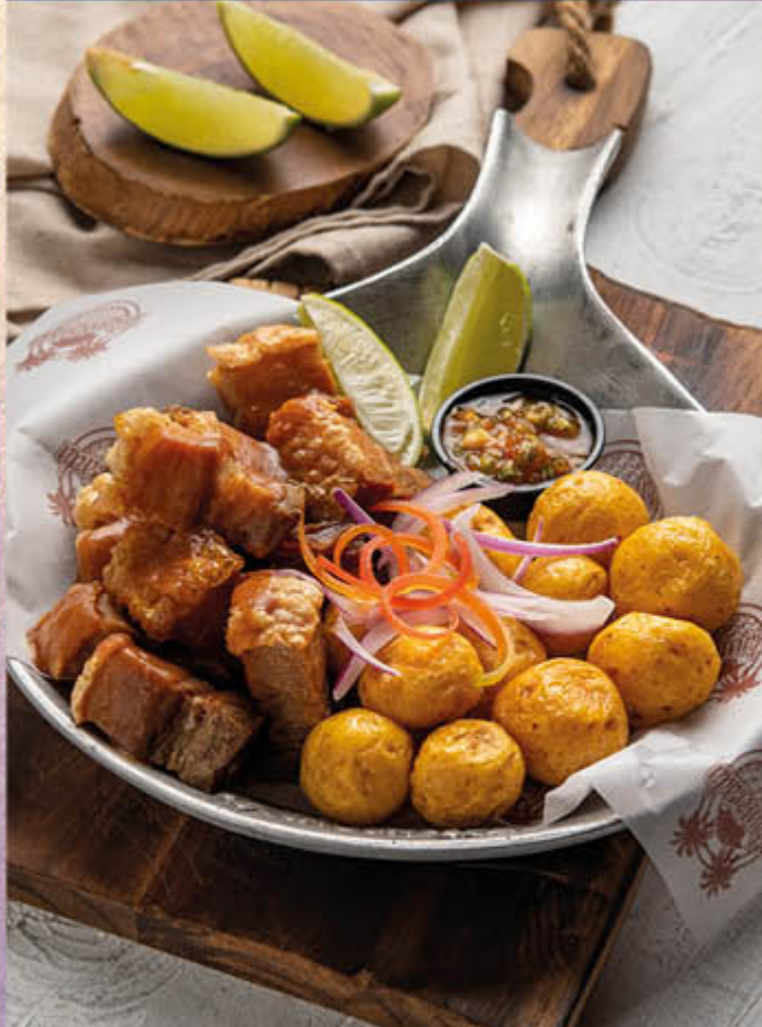
CHICHARRONES DE CERDO CROCANTES CON CHIMICHURRI. 240grs de chicharrones de cerdo en cocción lenta con papas criollas, chimichurri casero, ají parrillero y salsa de hierbabuena.