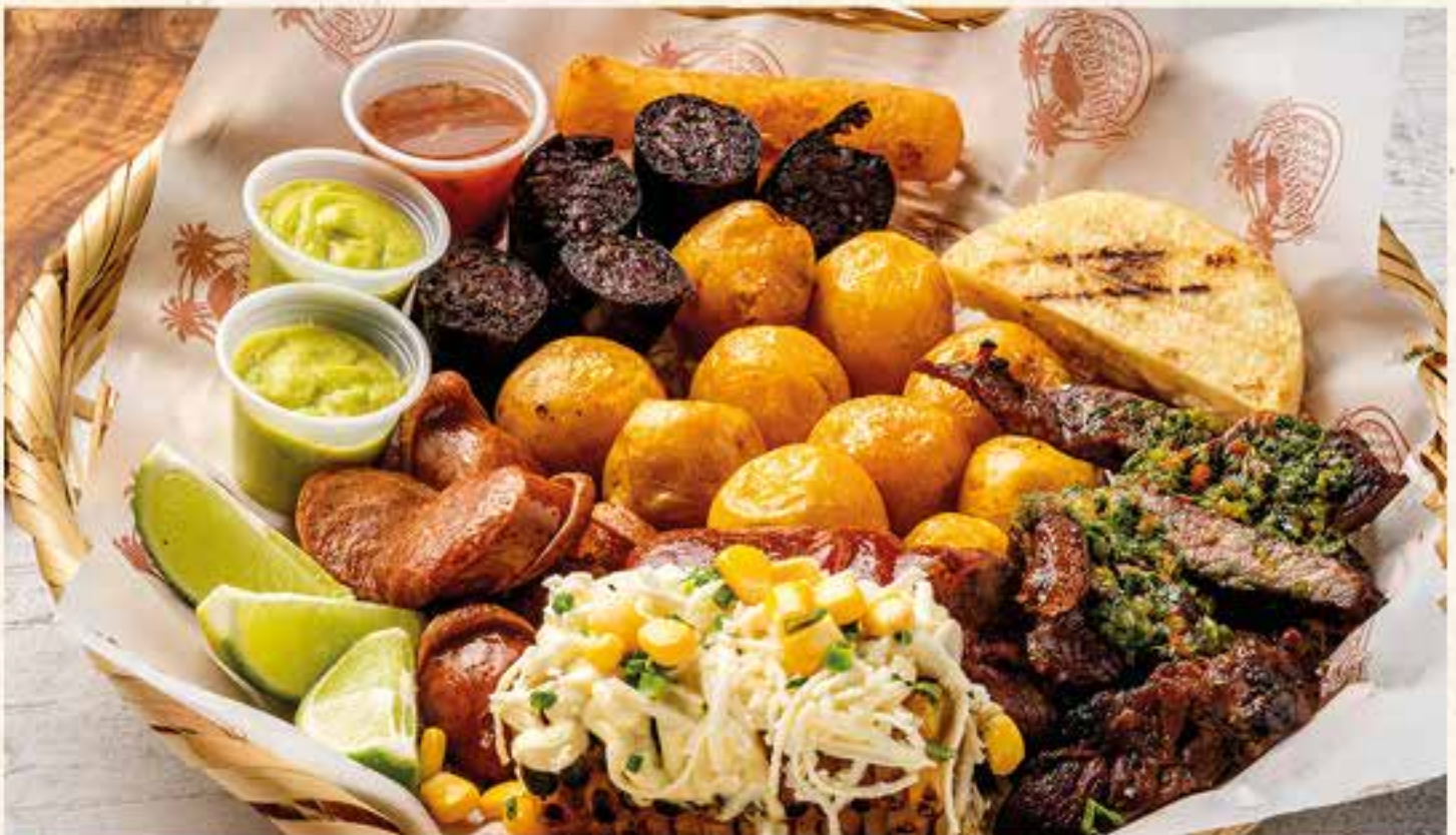
PICADA PERSONAL. Carne de res, morcilla, chorizo, mazorca, plátano maduro, yuca frita, arepa y papa criolla.