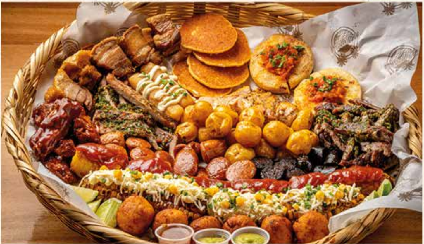
PICADA MEGAFAMILIAR. (para 8 personas) Disfruta nuestra especial picada pensando en toda tu familia. Carne de res, cerdo y pollo a la parrilla aderezadas con chimichurri, chorizo de cerdo y morcilla, arepas de queso y de chodo, papa criolla, mazorca tierna a la parrilla con sour cream y queso costeño, plátanos maduros con salsa de bocadillo, croquetas de plátano rellenas de chicharrón, costilla BBQ, chicharrón y croquetas de yuca. Acompañada de guacamole, aji criollo y limón.