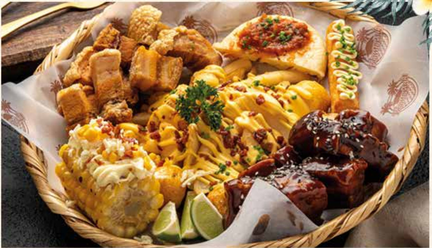
PICADA DE CHICHARRÓN CARNUDO.