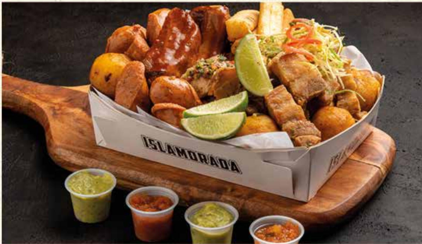
PICADA CAJA DEL CAMPO. Carne de cerdo a la parrilla aderezada con chimichurri, chorizo, croquetas de plátano rellenas de chicharrón, costilla BBQ, chicharrón, croquetas de yuca, papa criolla y plátano maduro con salsa de bocadillo, acompañada de guacamole, ají criollo y limón.