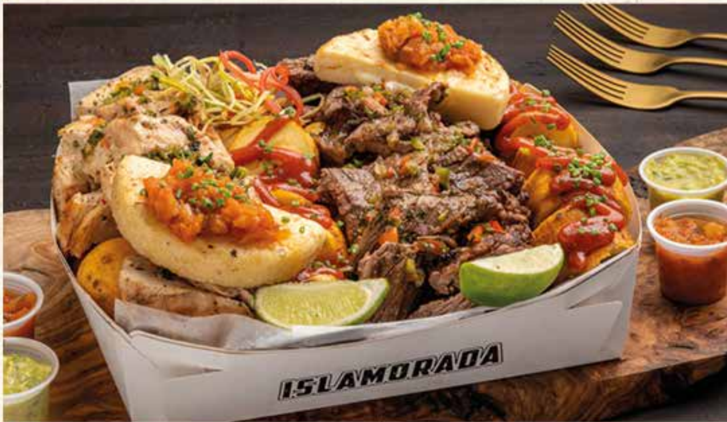
PICADA CAJA MIX DE CARNES. (Para 4 personas) Carne de res y pollo a la parrilla aderezada con chimichurri, papa criolla, arepas de queso con hogao y plátano maduro con salsa de bocadillo, acompañada de guacamole, aji Criollo y limón.