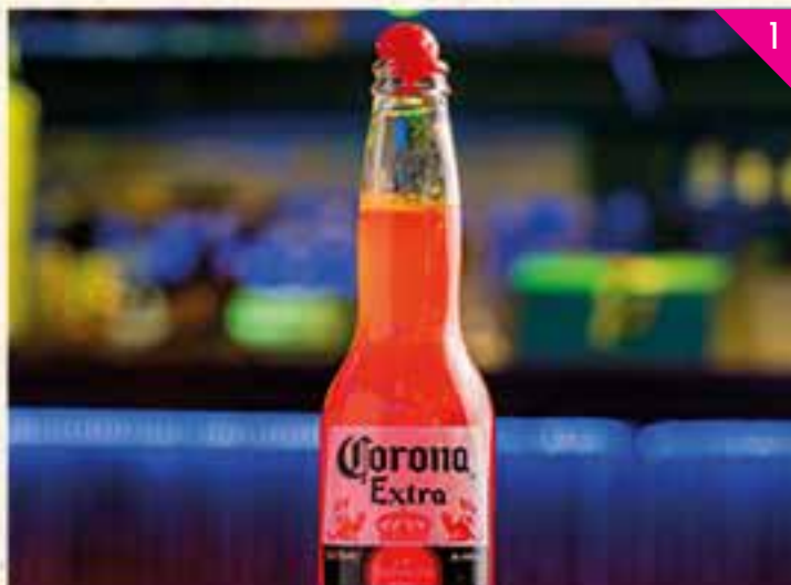
CORONA SUNRISE: Cerveza Corona con tequila, zumo de limón y mandarina, almibar de cereza y cerezas, acompañada de tajín y limón.