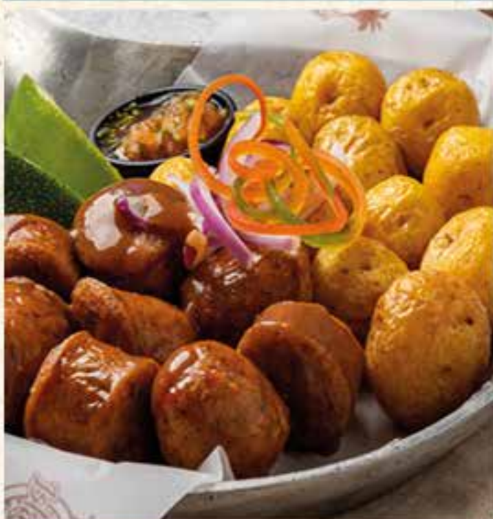
CHORIZO ARTESANAL A LA PARRILLA.