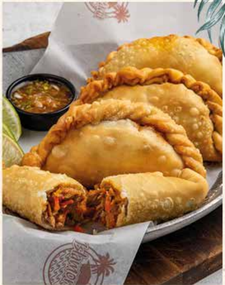
EMPANADAS DE ROPA VIEJA.