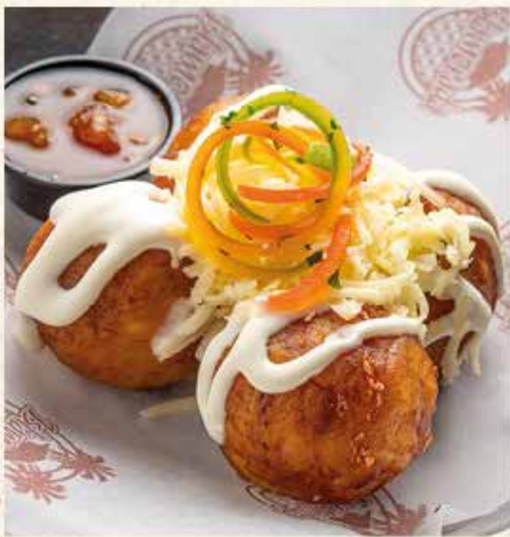
CROQUETAS DE PLÁTANO MADURO RELLENAS DE QUESO Y CHICHARRÓN.