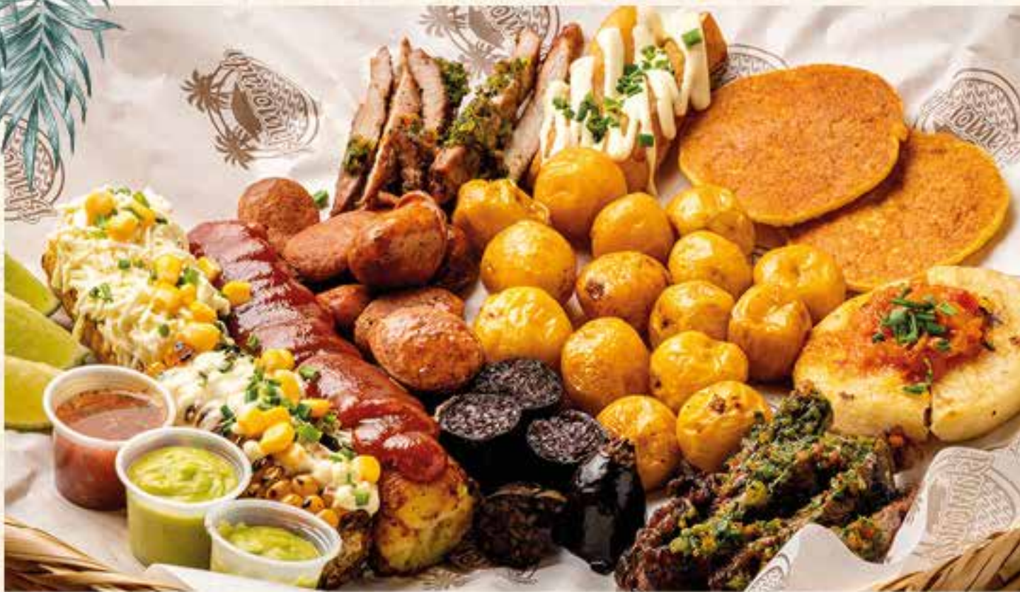
PICADA ISLAMORADA. (para 2 personas) Carne de res, lomo de cerdo, morcilla, chorizo, mazorca, plátano maduro, arepa de parrilla, arepa de choclo y yuca frita.