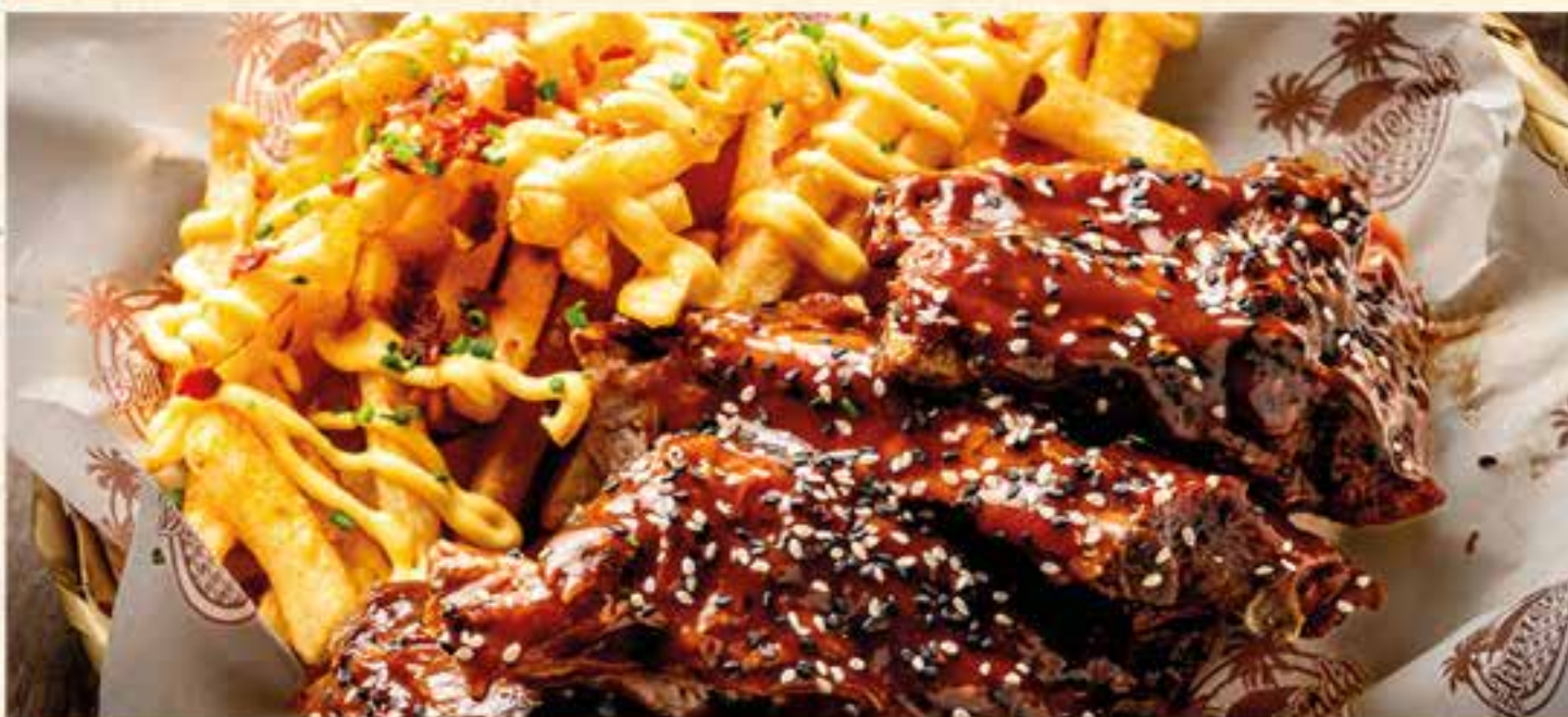
RACK RIBS EN BBQ AHUMADA. Costilla especial Baby Rack con cheesy fries.