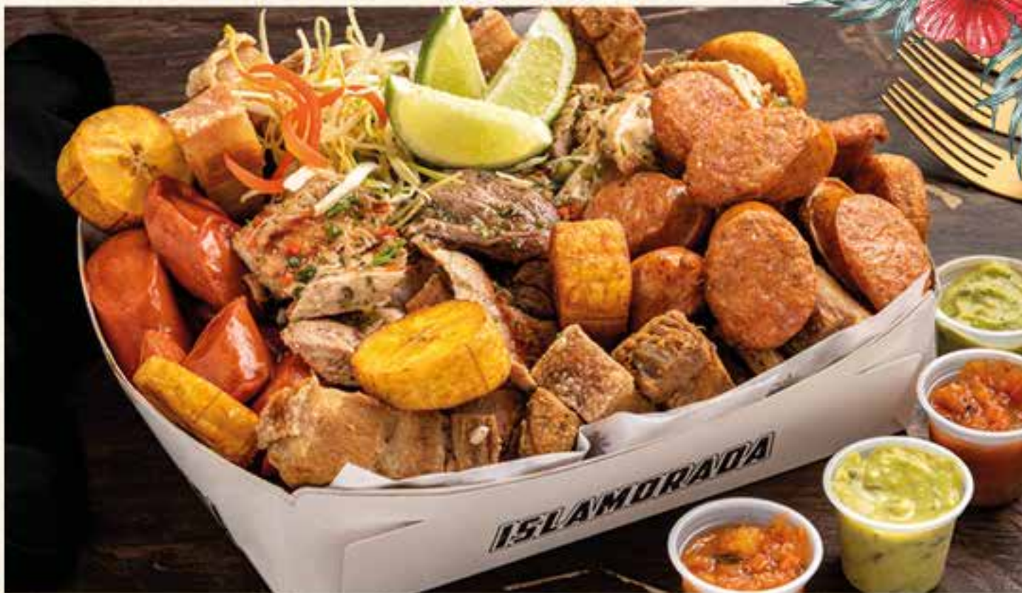
PICADA CAJA MIXTA. Mix de carnes a la parrilla (Res, cerdo y pollo ) aderezadas con chimichurri, con chorizo de cerdo, salchicha americana BBQ, plátano maduro con salsa de bocadillo, chicharrón y papa criolla, acompañada de guacamole, ají criollo y limón.