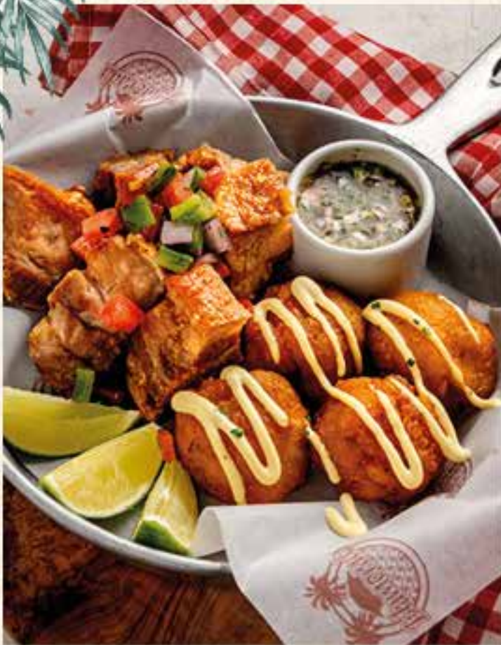
CHICHARRONES CROCANTES CON CROQUETAS DE PLÁTANO