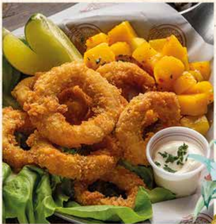
ANILLOS DE CALAMAR AL PANKO CROCANTES.