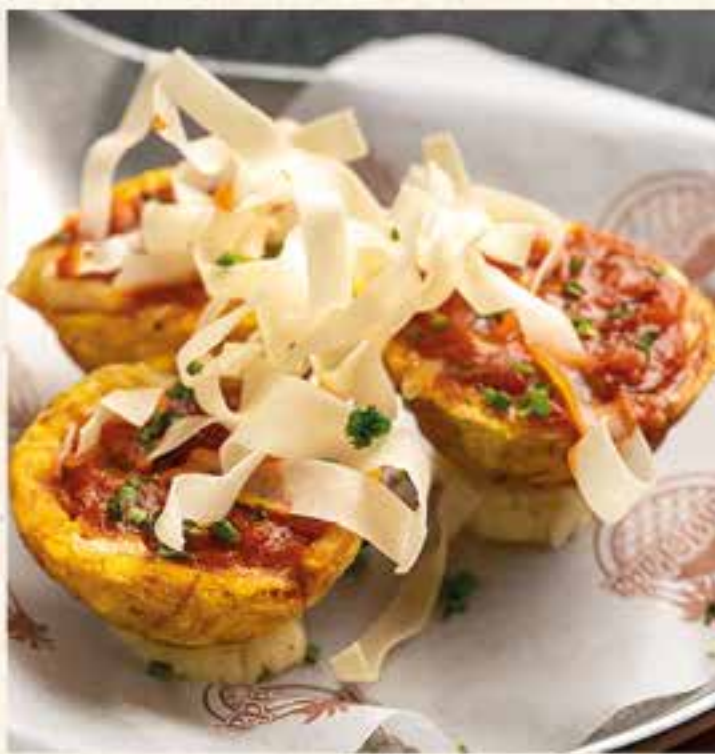
TOSTONES CON HOGAO Y QUESO.