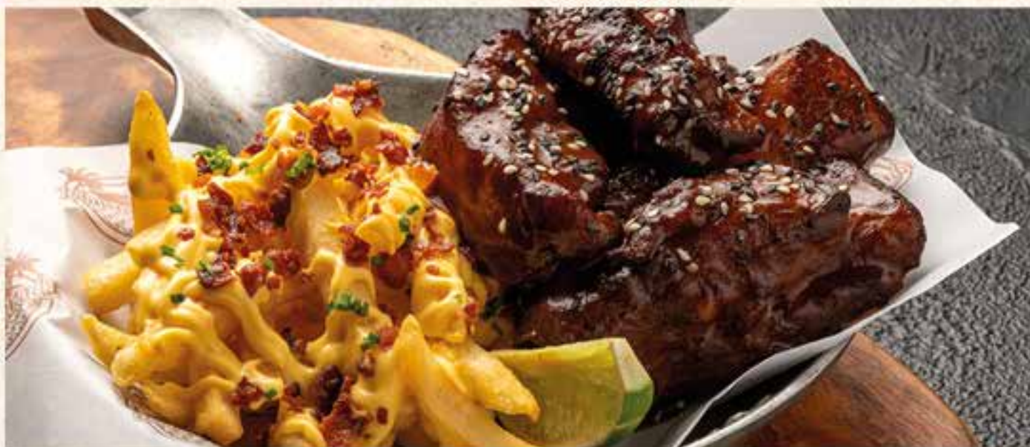
PICADA COSTILLAS BBQ (450 GRAMOS) CON CHEESE FRIES Y TOCINETA.