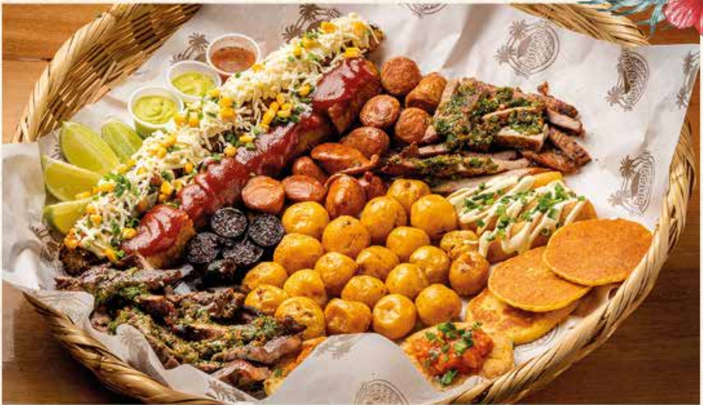
PICADA XL. (para 4 personas) Carne de res, morcilla, chorizo, mazorca, plátano maduro, yuca frita, arepa y papa criolla.